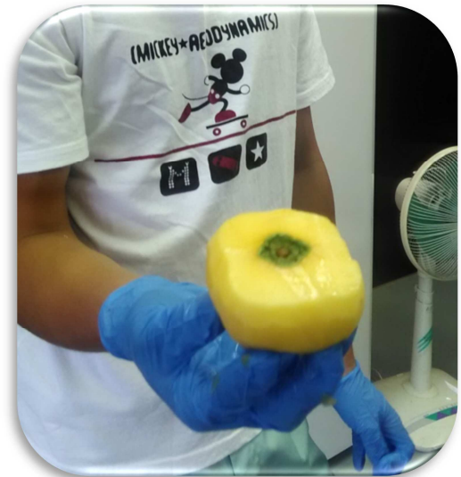
上手に剥けました