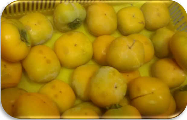
原材料となる渋柿「刀根早生」

果樹コースでは、9月下旬からカキ「刀根早生」の収穫が始まっています。収穫した果実の選果時には、形の悪い奇形果や傷果など出荷できない果実があります。そうした果実を活用して、「あんぽ柿」を作製しました。