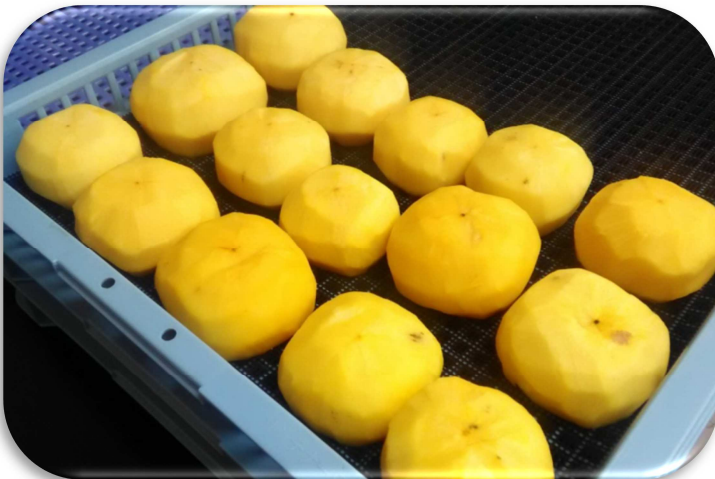
トレーに並べて乾燥機を使って乾燥させます。